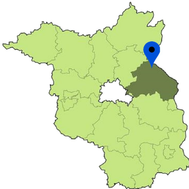
Übersicht Regenmengen in Dannenberg/Mark 2003 -2019